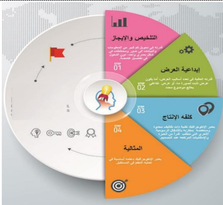
شكل خصائص الأنفوجرافيك