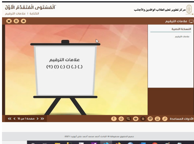
شكل (6) مهارة الكتابة - فيديو

2. إنتاج واجهات التفاعل والتفاعلات البيئية: قام الباحث بإنتاج صفحات الدروس بما يتضمنه من محتوى خاص بمهارتي الاستماع والكتابة وأدوات للإبحار كأزرار سابق وتالي وتكبير الشاشة وقائمة منسدلة للتنقل وطباعة الصفحة وإرسال رسالة بريد الكتروني وزر إعادة تحميل وزر المساعدة بما يتضمنه من روابط مهمة