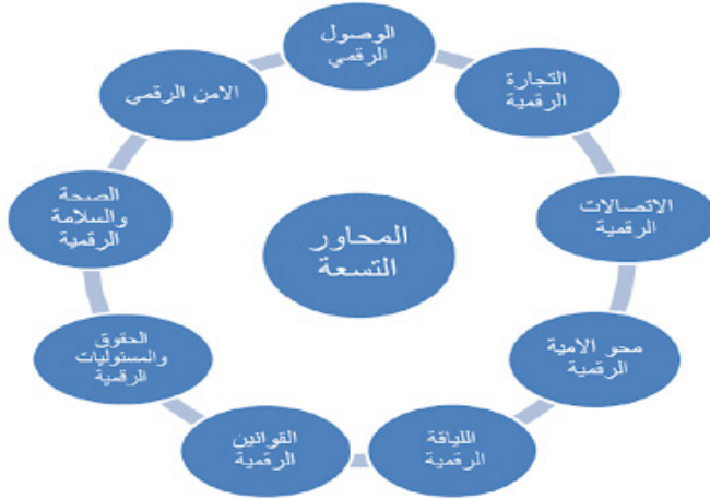
شكل (2) يوضح المحاور التسعة للمواطنة الرقمية

قدم ريبيل وبيلي قائمة بالموضوعات التسعة للمواطنة الرقمية، حيث يحتوي كل موضوع على عدد معين من المعايير التي توضح كيفية تشكيل المواطن الرقمي الصحيح الذي يستطيع مسايرة العالم الرقمي (Ribble،2011 & milner،2005).